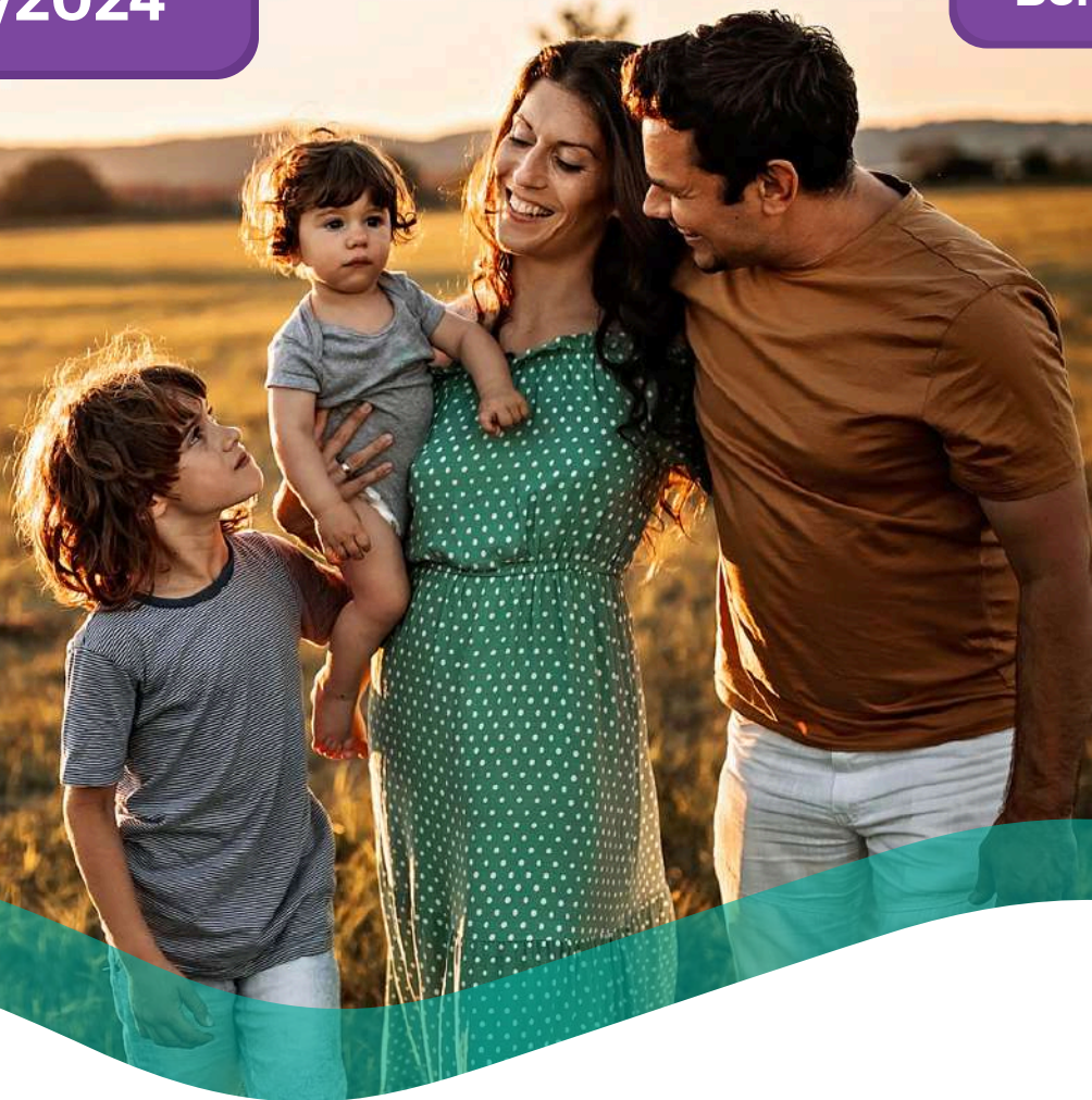
TABELA DE PREÇOS COLETIVO POR ADESÃO