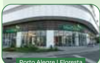
Porto Alegre | Floresta