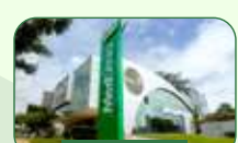
Brasília | Asa Sul