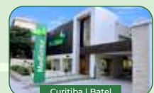
Curitiba | Batel