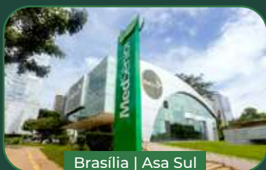
Brasília | Asa Sul