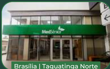
Brasília | Taguatinga Norte