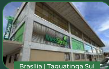
Brasília | Taguatinga Sul