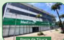
Barra da Tijuca