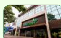
Belo Horizonte | Gutierrez