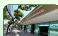
Belo Horizonte | Pampulha