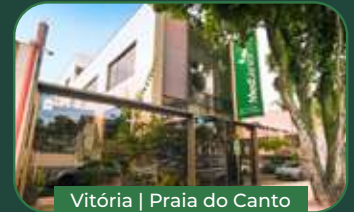
Vitória | Praia do Canto