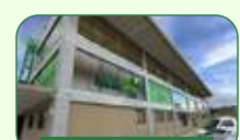
Brasília | Taguatinga Sul