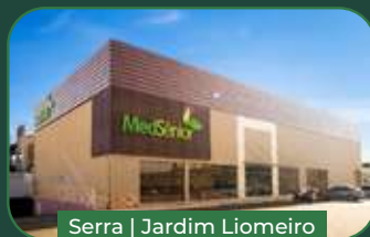
Serra | Jardim Liomeiro