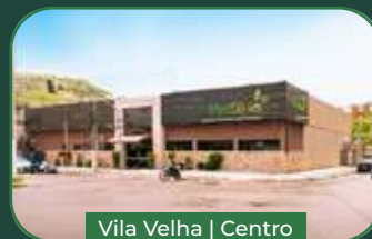
Vila Velha | Centro