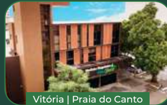
Vitória | Praia do Canto