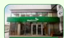
Brasília | Taguatinga Norte