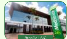
Brasília | SIC