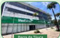
Barra da Tijuca