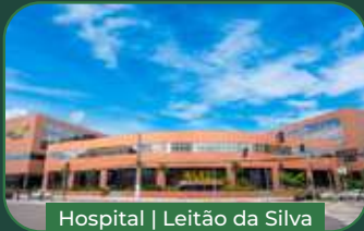
Hospital | Leitão da Silva