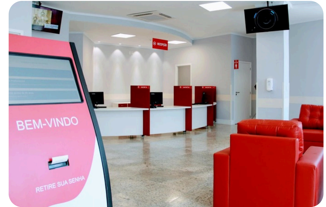
RECEPÇÃO: CONVÊNIOS E PARTICULARES