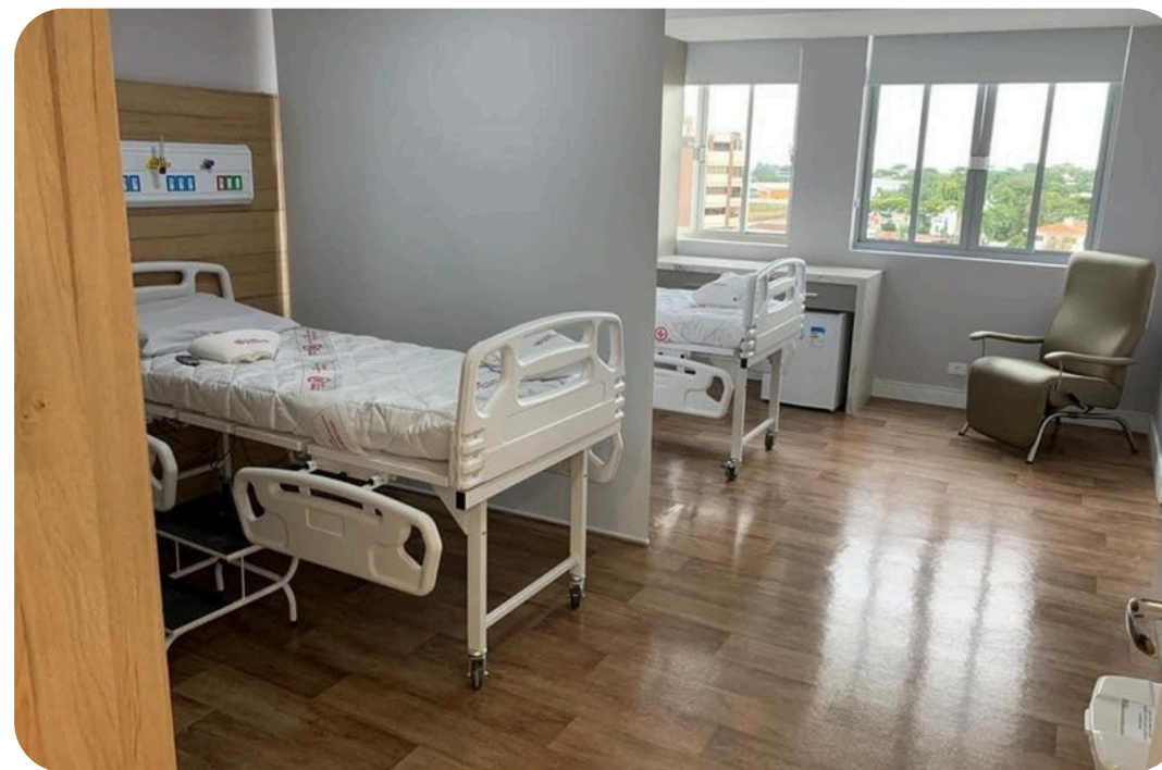
APARTAMENTOS SEMIPRIVATIVOS: CONVÊNIOS E PARTICULARES