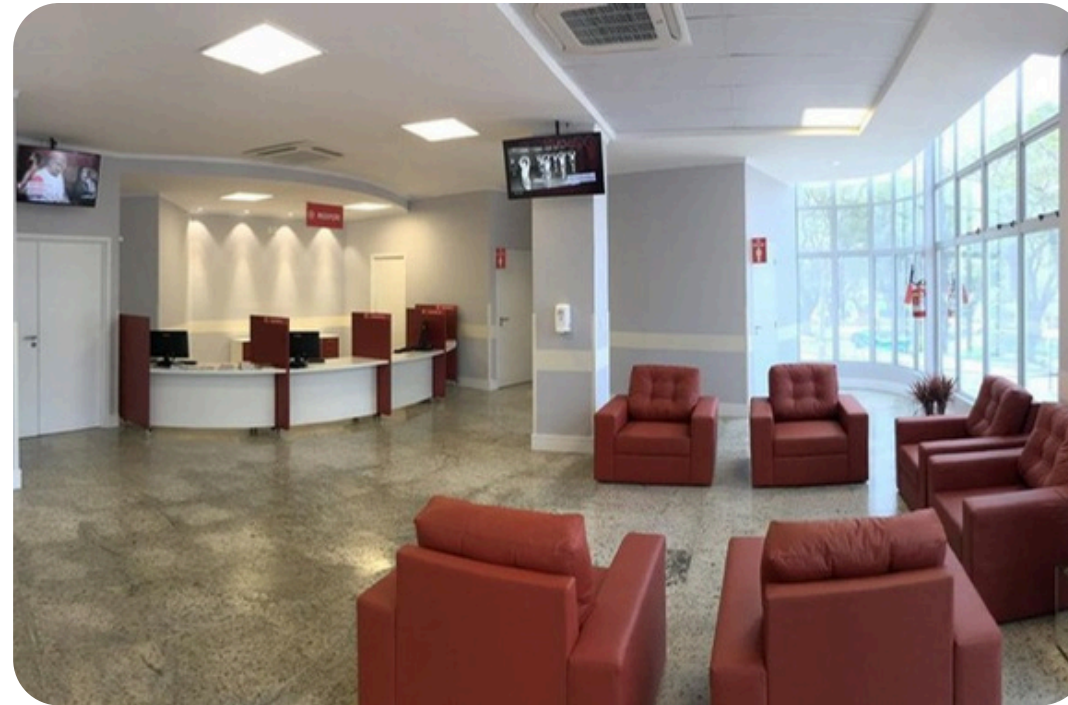
URGÊNCIA E EMERGÊNCIA: CONVÊNIOS E PARTICULARES

Ambientes e atendimentos exclusivos para beneficiários de planos de saúde