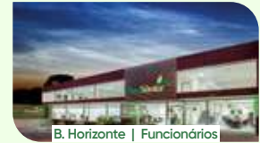
B. Horizonte | Funcionários