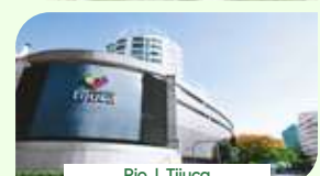
Rio | Tijuca