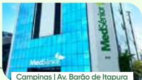
Campinas | Av. Barão de Itapuruca