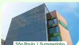
São Paulo | Sumarezinho