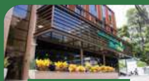
Vitória | Praia do Canto