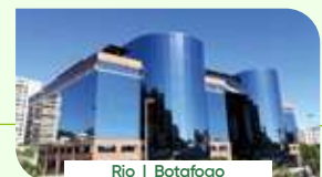
Rio | Botafogo