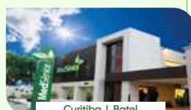
Curitiba | Batel