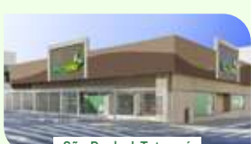
São Paulo | Tatuapé