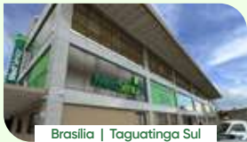
Brasília | Taguatinga Sul