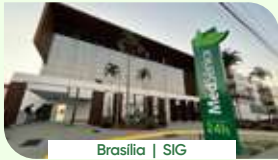
Brasília | SIG