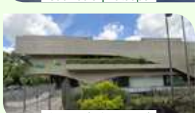
São Paulo | Av. Brasil