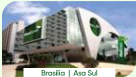
Brasília | Asa Sul