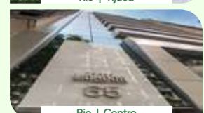
Rio | Centro