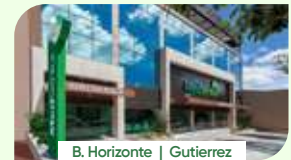
B. Horizonte | Gutierrez