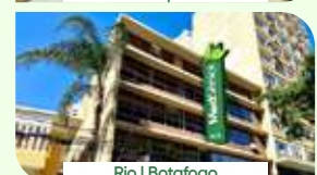
Rio | Botafogo