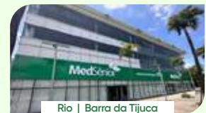
Rio | Barra da Tijuca