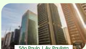
São Paulo | Av. Paulista