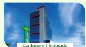
Contagem | Eldorado