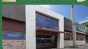
Vila Velha | Centro