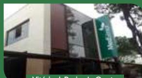
Vitória | Praia do Canto