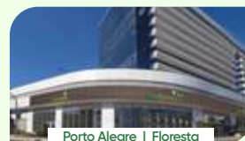
Porto Alegre | Floresta