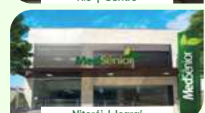
Niterói | Icaraí