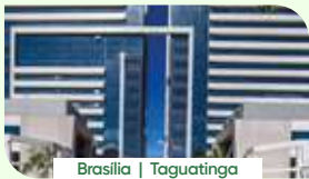
Brasília | Taguatinga