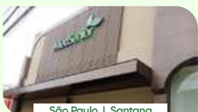
São Paulo | Santana