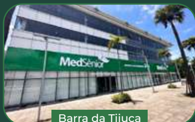
Barra da Tijuca