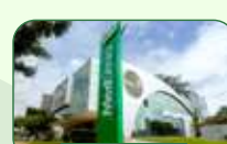
Brasília | Asa Sul