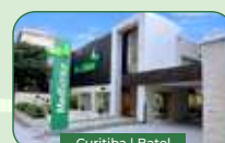
Curitiba | Batel