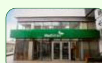
Brasília | Taguatinga Norte