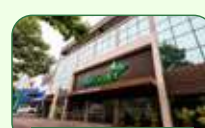
Belo Horizonte | Gutierrez