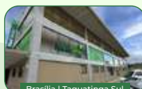
Brasília | Taguatinga Sul