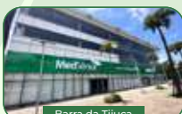
Barra da Tijuca