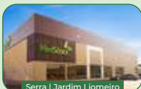
Serra | Jardim Liomeiro