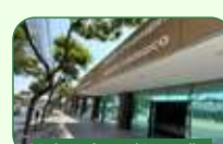
Belo Horizonte | Pampulha