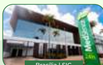
Brasília | SIO