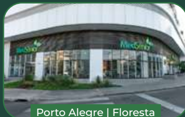
Porto Alegre | Floresta