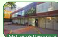
Belo Horizonte | Funcionários