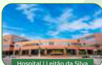
Hospital | Leitão da Silva