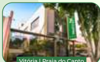
Vitória | Praia do Canto