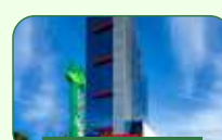
Contagem | Eldorado