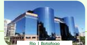
Rio | Botafogo