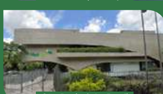
São Paulo | Av. Brasil