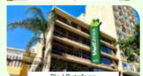
Rio | Botafogo