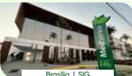
Brasília | SIG