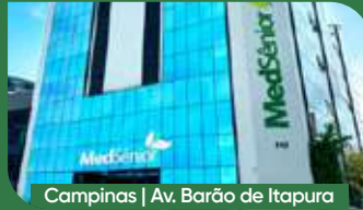
Campinas | Av. Barão de Itapura