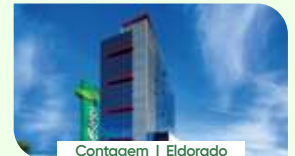
Contagem | Eldorado