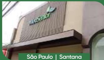
São Paulo | Santana