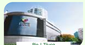
Rio | Tijuca