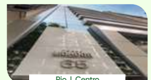
Rio | Centro