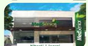
Niterói | Icaraí