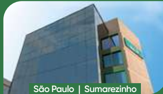
São Paulo | Sumarezinho