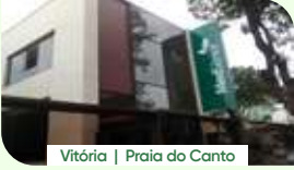
Vitória | Praia do Canto