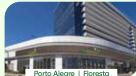
Porto Alegre | Floresta