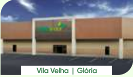
Vila Velha | Glória