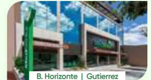
B. Horizonte | Gutierrez