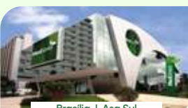
Brasília | Asa Sul