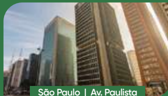
São Paulo | Av. Paulista