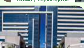
Brasília | Taguatinga