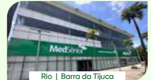
Rio | Barra da Tijuca