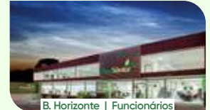
B. Horizonte | Funcionários