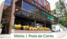
Vitória | Praia do Canto