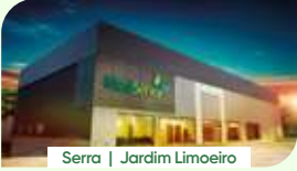
Serra | Jardim Limoeiro