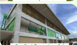
Brasília | Taguatinga Sul