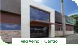
Vila Velha | Centro