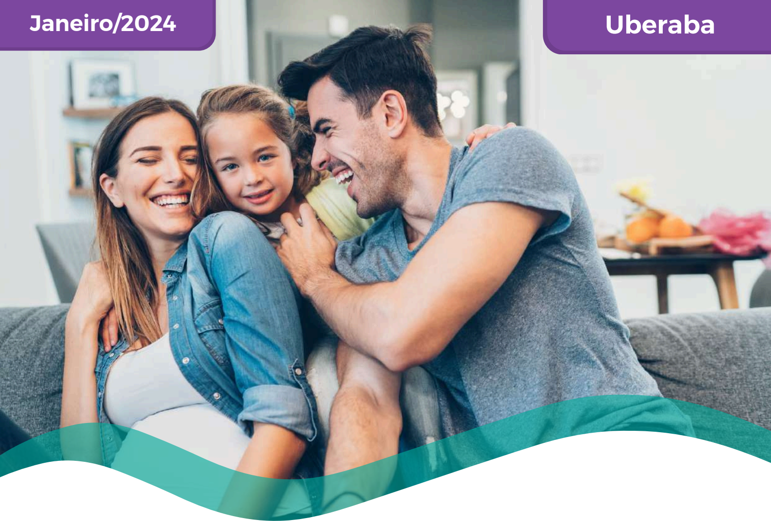
TABELA DE PREÇOS COLETIVO POR ADESÃO