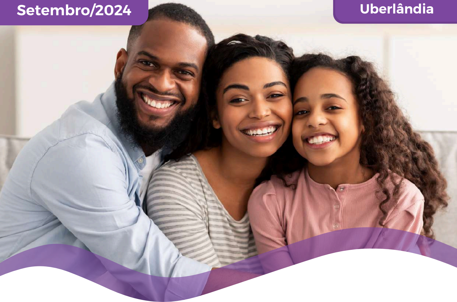
TABELA DE PREÇOS COLETIVO POR ADESÃO