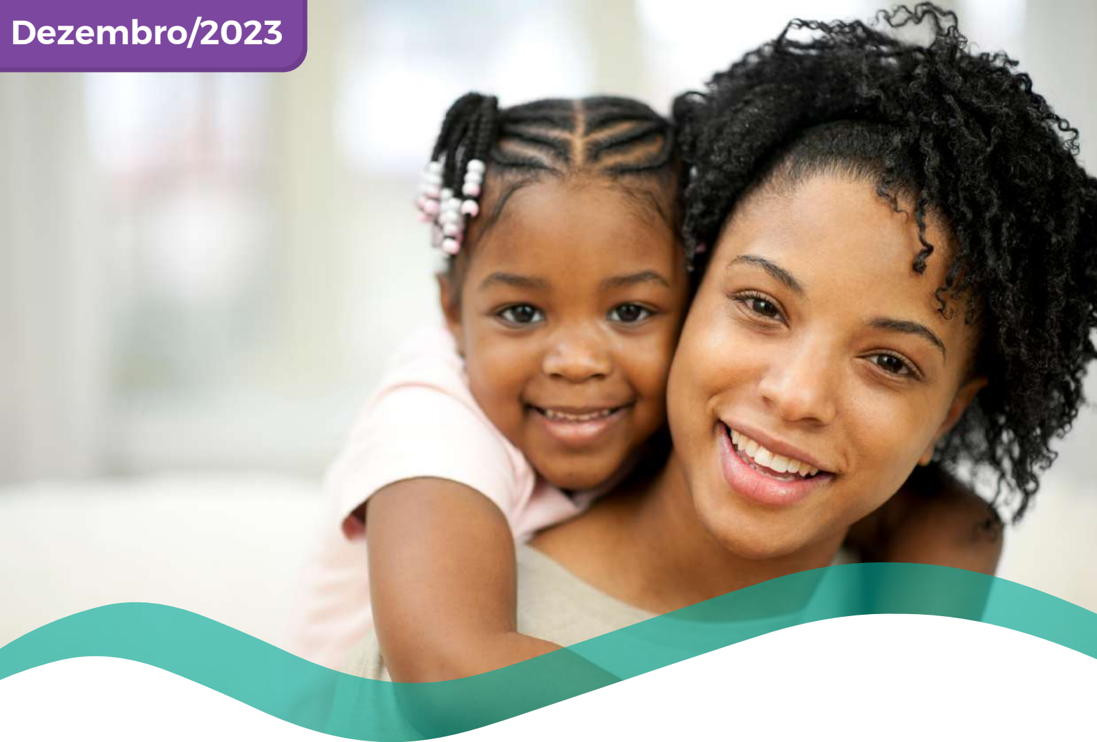
TABELA DE PREÇOS COLETIVO POR ADESÃO