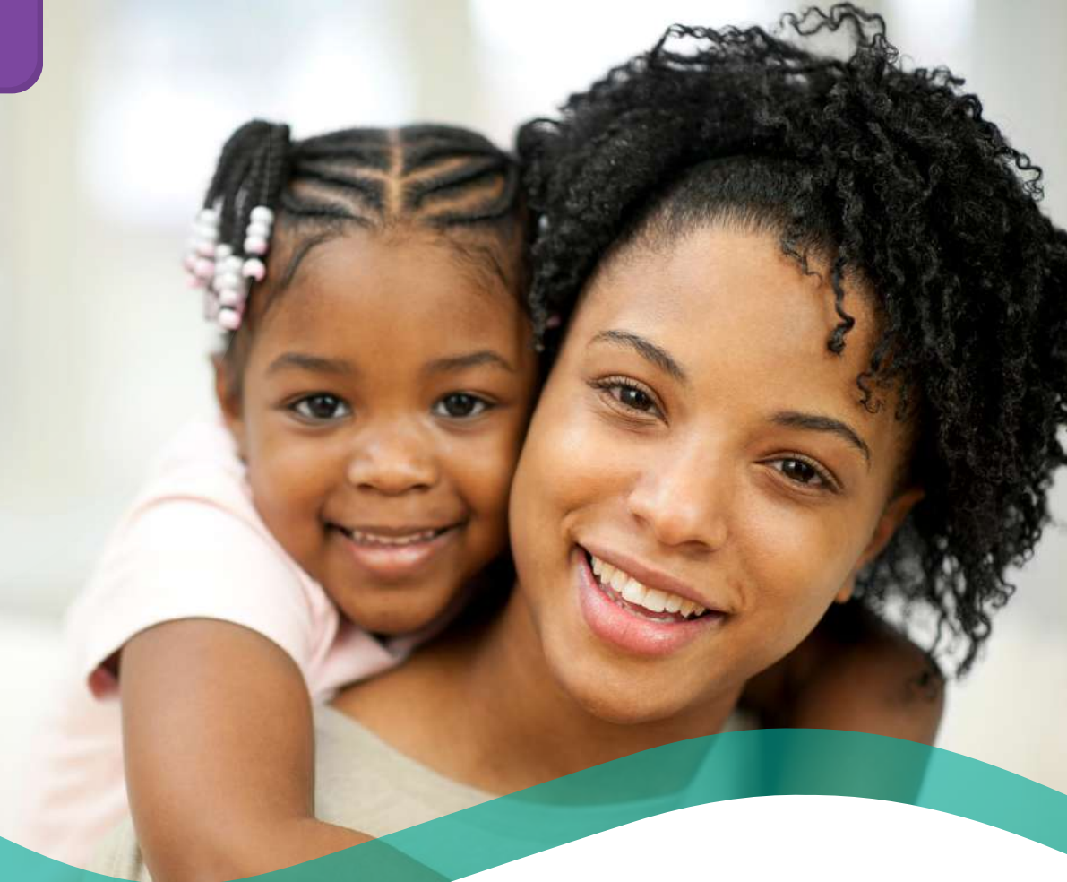
TABELA DE PREÇOS COLETIVO POR ADESÃO